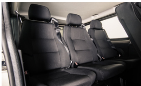
Fotele z regulowanym zagłówkiem