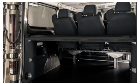
Wzmocniona podłoga przestrzeni ładunkowej