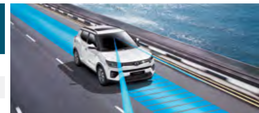
LDWS/LKAS – asystent pasa ruchu