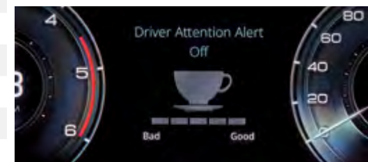
DAA – asystent zmęczenia kierowcy