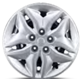
16" felgi stalowe z kołpakami (205/65)