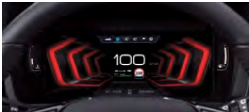
10,25" wyświetlacz LCD HD