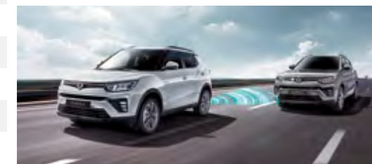
BSD - system ostrzegania o pojazdach w martwym polu lusterek