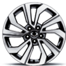
18" felgi aluminiowe "diamentowe" (215/50)