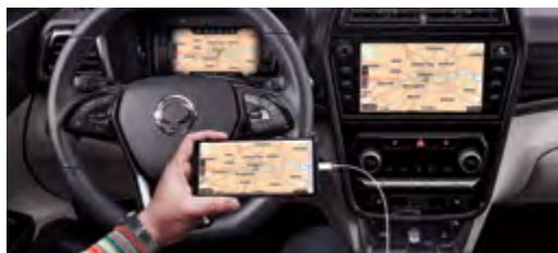
Dual Navi/ Android Auto/ Apple CarPlay