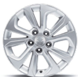
16" felgi aluminiowe (205/65)