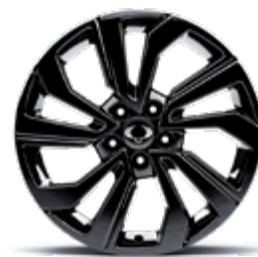
18" felgi aluminiowe czarne "diamentowe" (215/50)