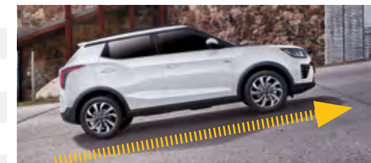
HSA – asystent wjazdu na wzniesienia