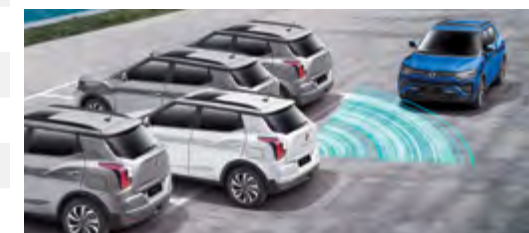
RCTA – radar ruchu poprzecznego