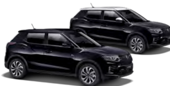
Space Black (metal.)