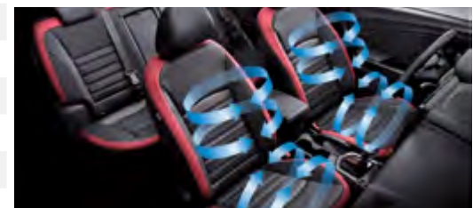
Wentylowane fotele z przodu