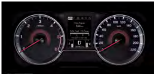
3,5" LCD – wyświetlacz komputera pokładowego