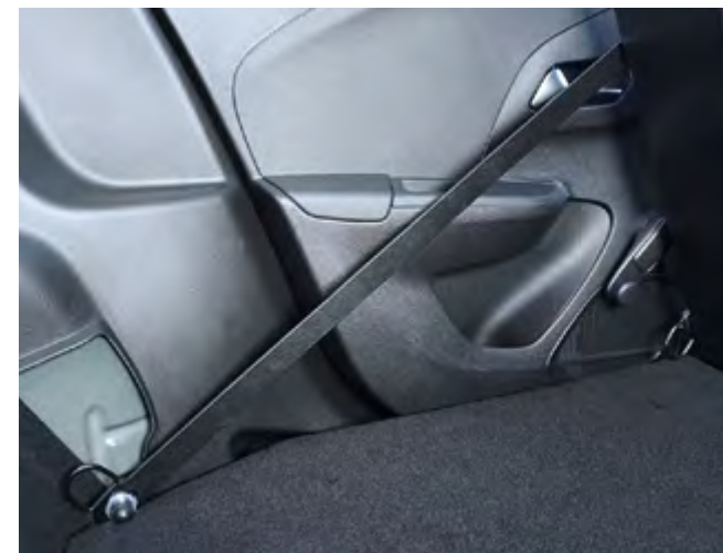
► UCHWYTY. Wiele punktów mocowania ładunku.