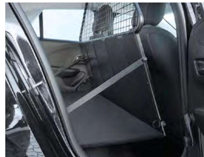
► DRZWI BOCZNE TYLNE. Wygodny dostęp do ładunku nie tylko od tyłu.