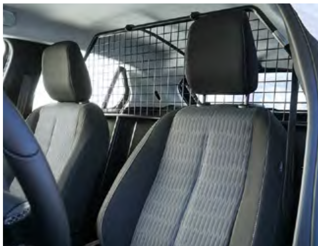
► PRZEGRODA. Wytrzymała krata zabezpieczająca przedział osobowy jednocześnie dająca możliwość pełnego odsunięcia foteli.

Elementy zdemontowane mogą być użyte do ponownej konwersji z samochodu ciężarowego na osobowy 5 miejscowy. Przebudowa w wyspecjalizowanym zakładzie obejmuje demontaż podłogi i kraty bagażowej oraz m.in. montaż tylnej kanapy i elementów wyposażenia bagażnika. Wymagane jest uzyskanie oświadczenia o spełnieniu warunków homologacji osobowej oraz przegląd techniczny, zgodnie z Prawem o Ruchu Drogowym. Po zakończeniu eksploatacji Corsy Van ponowna konwersja, przy współpracy z Dealerem marki Opel, nie jest trudna. Samochód osobowy łatwiej jest odsprzedać za wyższą cenę na rynku wtórnym.